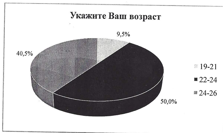
Рисунок 3. Ответы на вопрос 3: «Укажите Ваш возраст».